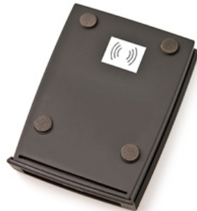
Рис.2 Дополнительная антенна

Порядок работы считывателя подробно описан в документации на используемое ПО.